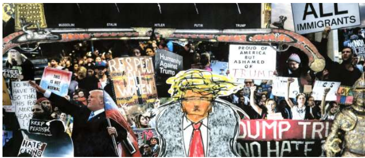
Detalj ur Trump and fascist five.