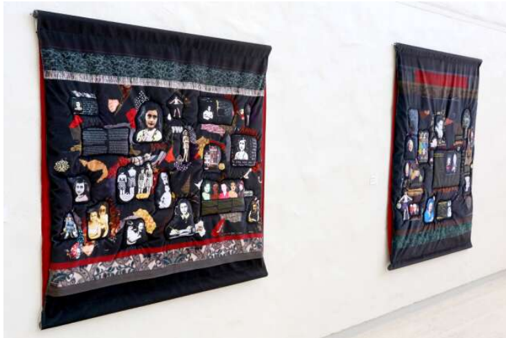
Textila verk som konstmuseet köpt in vid sidan av donationen.