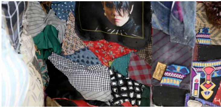
Noomi Rapace som Lisbeth Salander, i svenska filmen Män som hatar kvinnor, har fått plats i ett kollage.