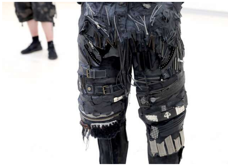
Fierce femininity i läder och metall är en av skulpturerna.

📍 KULTUR 📍 NÖJE/KULTUR 📍 SKÖVDE KULTURHUS